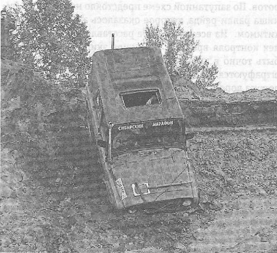
Недетские игры в песчнице ▼