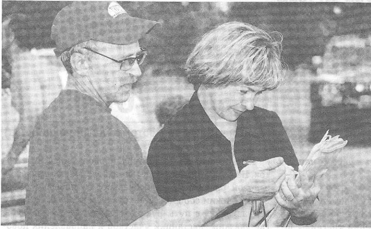
▲ Команда строгих судей за работой Снисхождения никто не жди